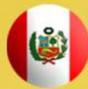
Guillermo Atencio Ministerio de Salud