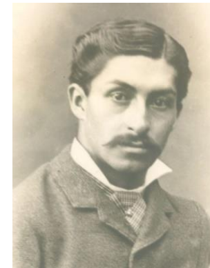
Daniel A. Carrión

Los avances prosiguieron en el siglo XX con valiosos aportes