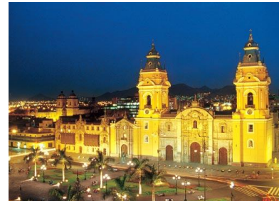
La Catedral de Lima, Plaza de Armas

Fundada el 18 de enero de 1535, Lima, la capital del Perú, es una ciudad moderna en constante crecimiento, pero que ha sabido mantener al mismo tiempo, la riqueza de su Centro Histórico, declarado por la UNESCO como Patrimonio Cultural de la Humanidad, por ser un remanso encantador de una época pasada, copado de incomparables monumentos artísticos.